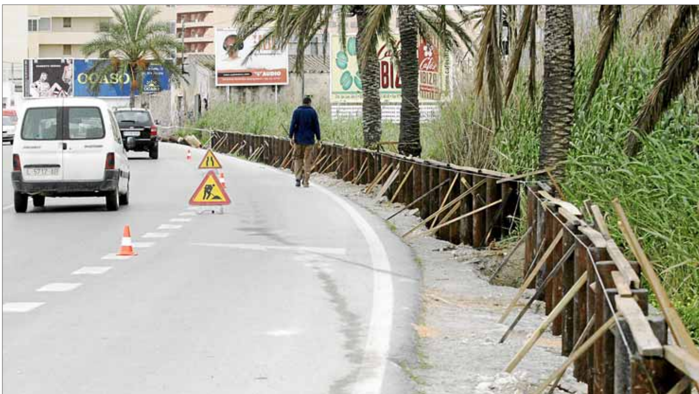
El Ayuntamiento de Vila quiere evitar el caos que se forma sobre todo en verano en la zona y así proteger este espacio.