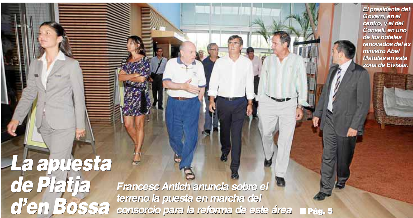
El presidente del Govern, en el centro, y el del Consell, en uno de los hoteles renovados del ex ministro Abel Matutes en esta zona de Eivissa.