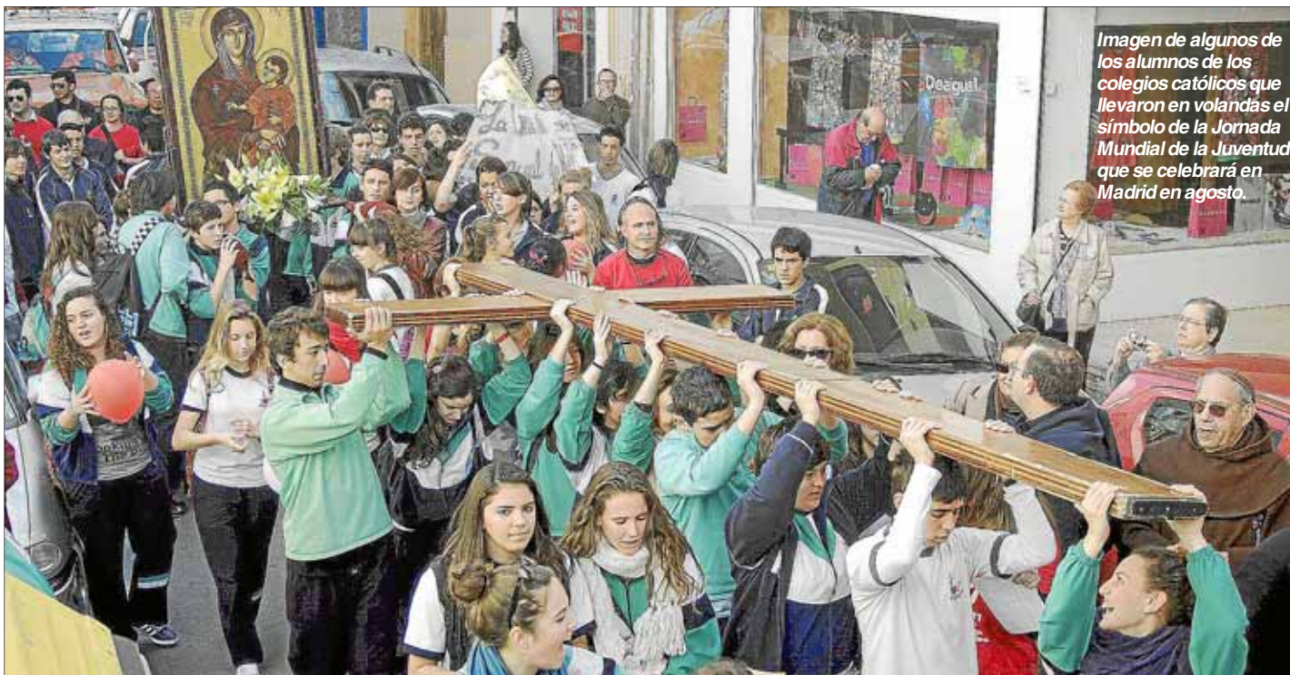
Imagen de algunos de los alumnos de los colegios católicos que llevaron en volandas el símbolo de la Jornada Mundial de la Juventud que se celebrará en Madrid en agosto.