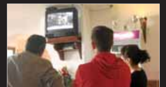
Vecinos de Sant Antoni siguen las noticias del suceso por televisión.