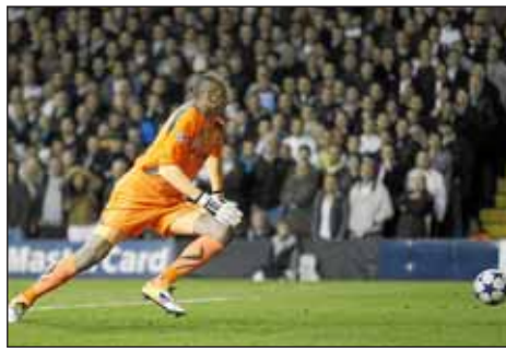
Una 'cantada' del puerta del Tottenham propició el gol.

EIVISSA, JUEVES, 14 DE ABRIL DE 2011 Precio: 1,10 €. Año CXVIII. Número 37.361 D.L.I. 63-2008