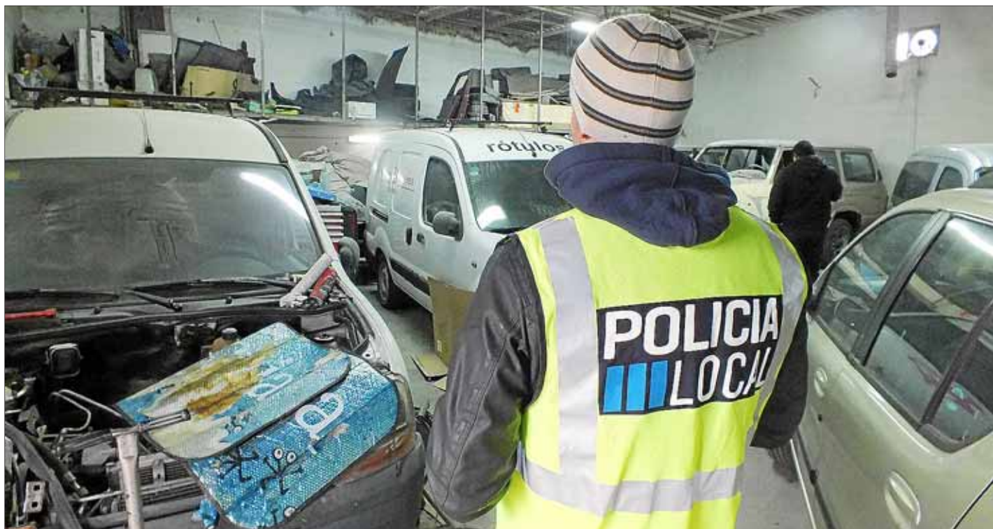
Un policía local de Sant Antoni comprueba la situación de uno de los negocios, ubicado en Can Tomas.