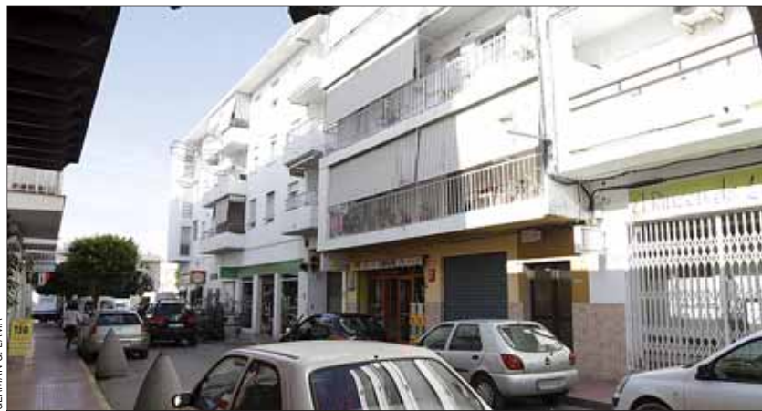
Los afectados fueron evacuados de su vivienda en la calle Soledad de Sant Antoni.