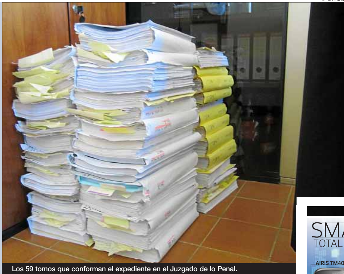
Los 59 tomos que conforman el expediente en el Juzgado de lo Penal.