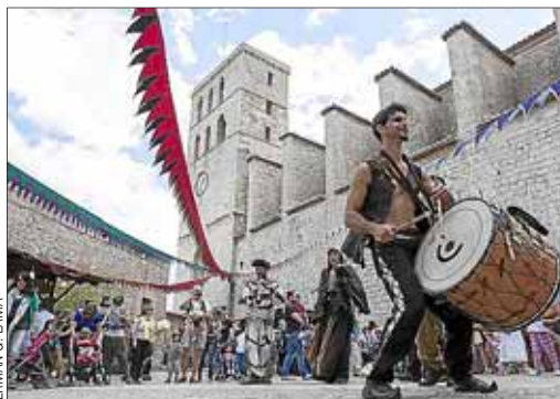
La Feria Medieval acogió ayer a centenares de personas de todos los rincones de la Isla.

LOCAL • Página 12 Una cita con el medioevo para bolsillos solventes