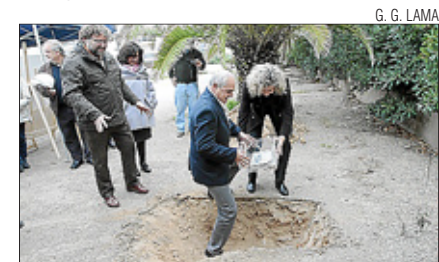
G. G. LAMA

El primer paso. Sant Josep planta la primera piedra del auditorio del Caló de s'Oli, el edificio polivalente que dará servicios socioculturales a la zona de la bahía de Portmany. • Página 11