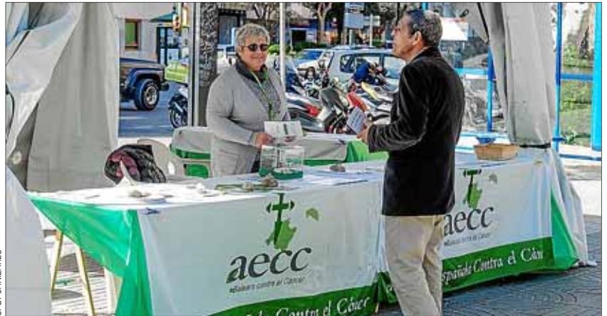
Imagen de la mesa informativa que se instaló ayer en s'Alamera.