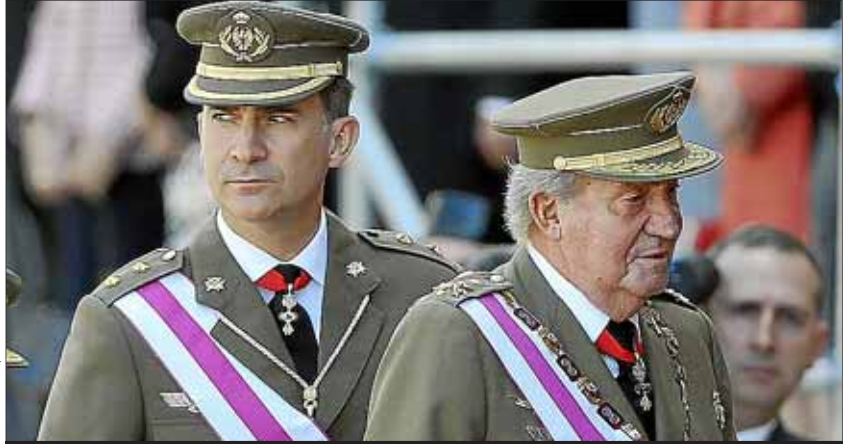
El príncipe Felipe y el Rey, en un acto castrense celebrado en El Escorial (Madrid).