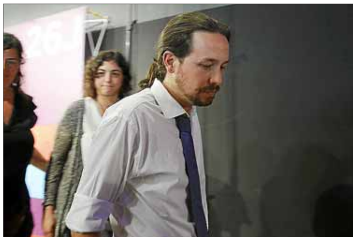
Pablo Iglesias no podía disimular la decepción por el fracaso electoral. A la derecha, Rajoy lanza besos a los militantes del PP.

El PP logra 137 escaños y crecen sus opciones para poder gobernar