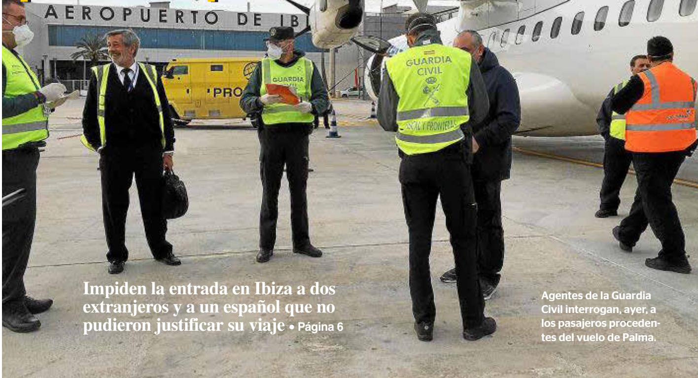
Impiden la entrada en Ibiza a dos extranjeros y a un español que no pudieron justificar su viaje • Página 6