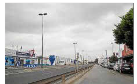
La zona comercial de la carretera de Santa Eulària, desértica, ayer por la mañana.