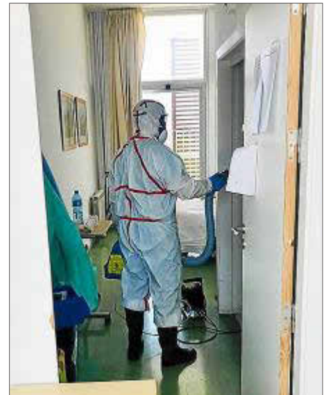
Un operario de Santa Eulària, desinfectando ayer una habitación de Can Blai.

Decenas de profesionales sanitarios de Ibiza optan por autoaislarse para proteger a sus familias • Pág. 5