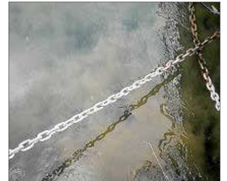
Tras el chaparrón de ayer por la mañana, el aliviadero del puerto volvió a verter fecales.