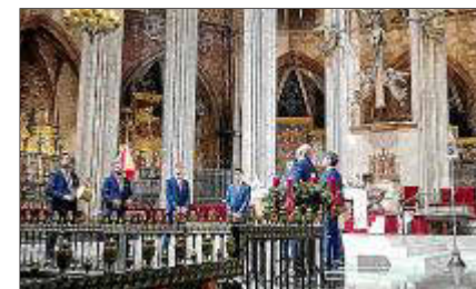
Actuación en la Catedral de Barcelona.