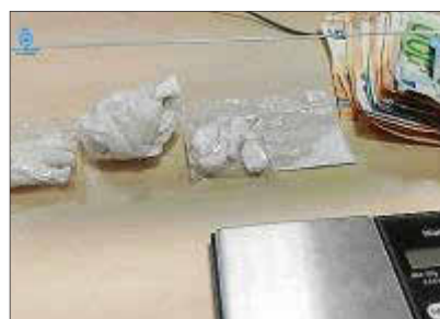
Sustancias y dinero intervenido.