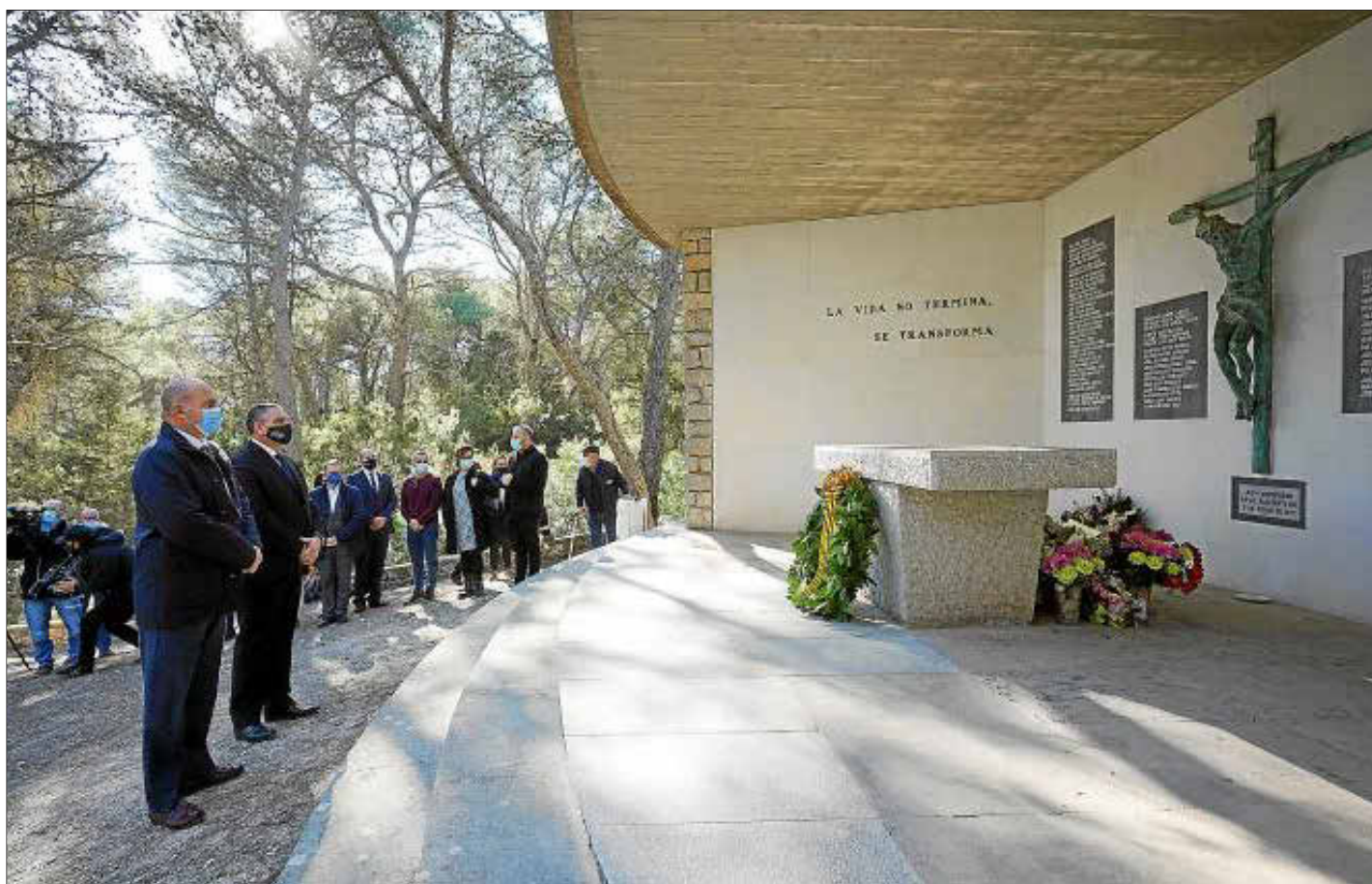
Los tres días de homenaje empezaron ayer con la entrega de una corona de laurel en la capilla y una misa oficiada por el obispo.

El aviso. El centro de salud de Vila colgó a primera hora de ayer este cartel informativo avisando de que no habría consultas presenciales para adultos y lo difundió a través de sus redes sociales. Horas después, y tras el revuelo suscitado, lo retiraron.