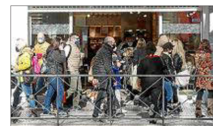
Gente en Bartomeu Roselló.

Las aerolíneas recortan sus conexiones con Ibiza tras las Navidades • Pág. 10