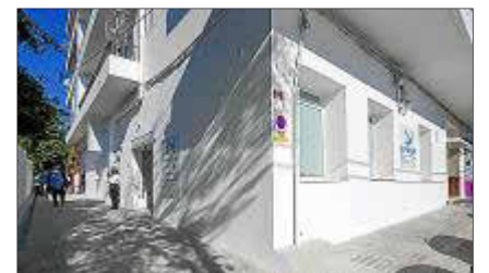
Imagen de la nueva sede.