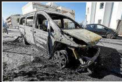
02.17 h. La cadena continuó con varios coches y contenedores en Vara de Rey.