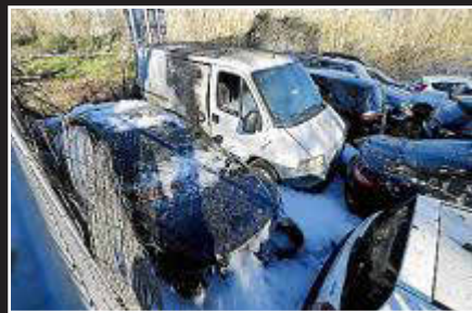
00.45 h. Tres vehículos quedaron calcinados por el incendio en el antiguo retén.