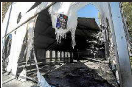
21.55 h. Las llamas devoraron buena parte de la carpa del Passeig de ses Fonts.

SUCESOS • Guardia Civil y Policía Local investigan la posible intencionalidad de la cadena de cuatro incendios que afectaron a 14 coches y seis contenedores • También analizan el incendio previo en la carpa • Págs. 12 y 13