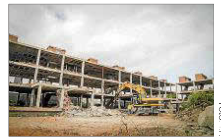
Imagen de los trabajos de derribo.

► Solo acudieron al centro 10 de los 55 alumnos • Pág. 8