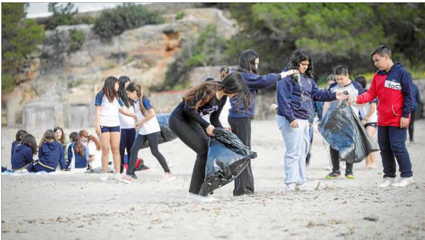
Los estudiantes se emplearon a fondo en la recogida de residuos.

▶ La diputada socialista, entrevistada en 'BNP' de TEF • Pág. 6