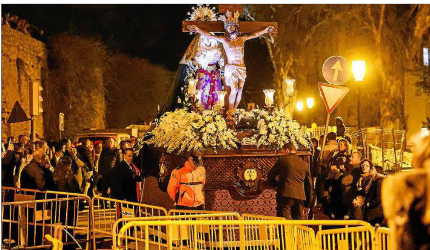
Las cofradías guardaron extrema precaución durante el recorrido por las calles de Dalt Vila.