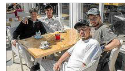
Turistas, en ses Figueretes.