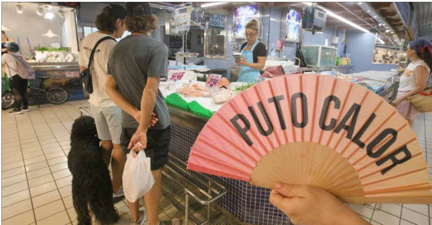
Los abanicos se han convertido en los mejores aliados para paradistas y clientes.